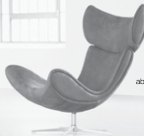
Imola Sessel ab CHF 2'295

Imola ist mehr als bloss ein Sessel. Er kann ganz nach Ihren Wünschen gestaltet werden. Wählen Sie aus einer Vielzahl an verschiedenen Farben, Materialien und Ausführungen, um Ihren individuellen Sessel zu kreieren. Und dies gilt nicht nur für Imola, sondern für alle Designs unserer Kollektion. Mehr Infos unter www.boconcept.ch