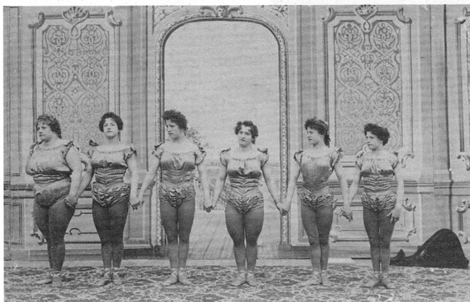
Standfoto aus dem Film «Lose Hose Dream Dress Show». Photo extraite du film «Lose Hose Dream Dress Show».

Le programme complet est consultable à partir de début avril sur le site → www.pinkapple.ch .